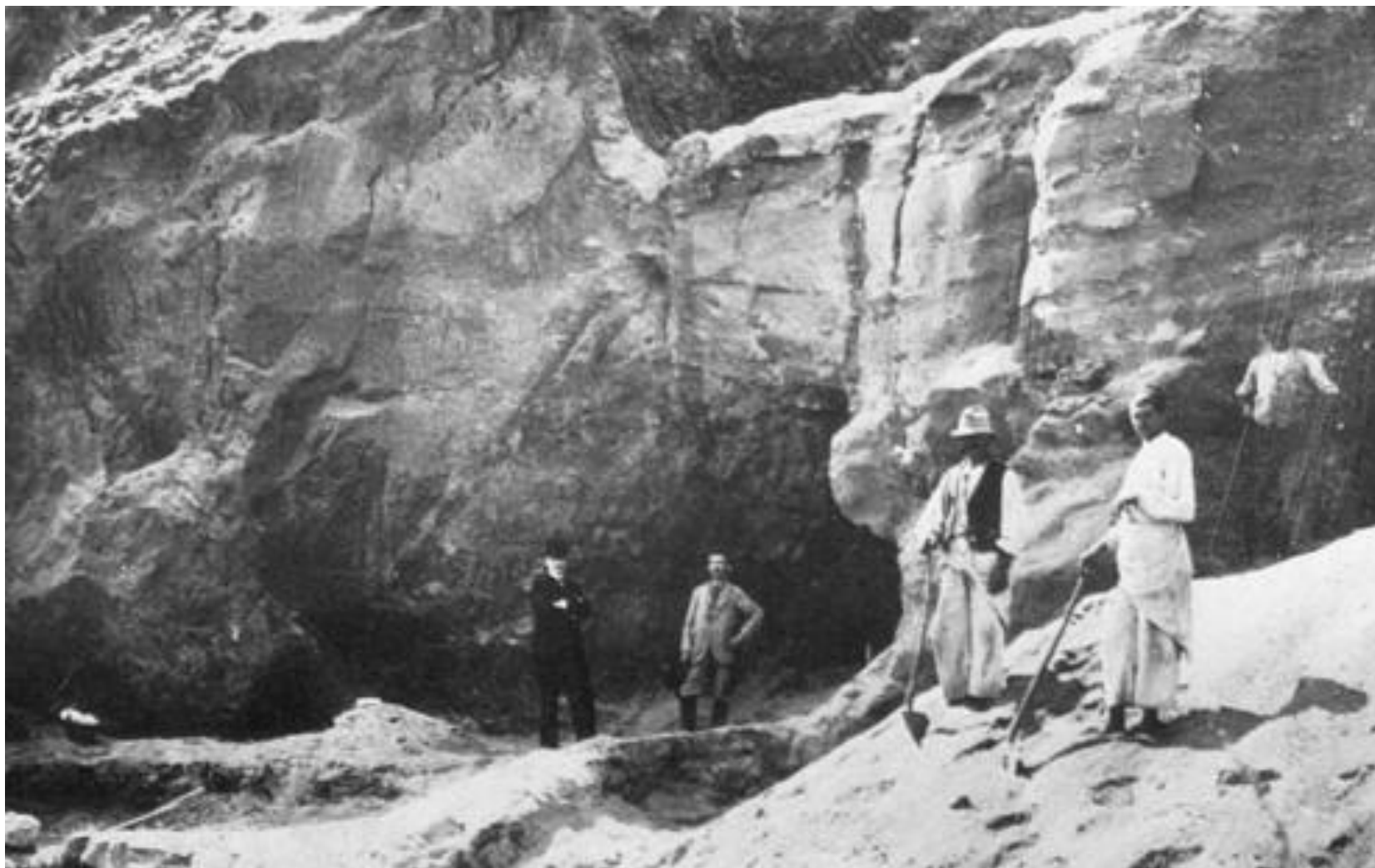
- prof. Gorjanović- Kramberger (lijevo), oko 1900. godine